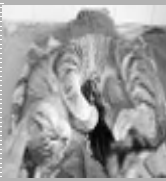
Ninhada de gatos tigrados;