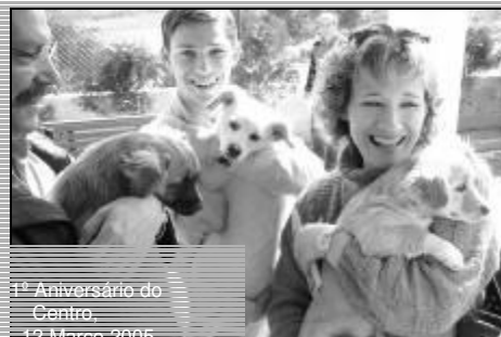
1º Aniversário do Centro, 12 Março 2005