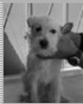
Macho, 1 ano, parecido com caniche;

Se pretende adoptar um animal sem dono veja os disponíveis no Centro Veterinário Municipal.