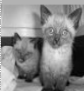
Gatos siameses, 2 meses.

Veja mais animais em: http://centrovetvalongo.fotopages.com